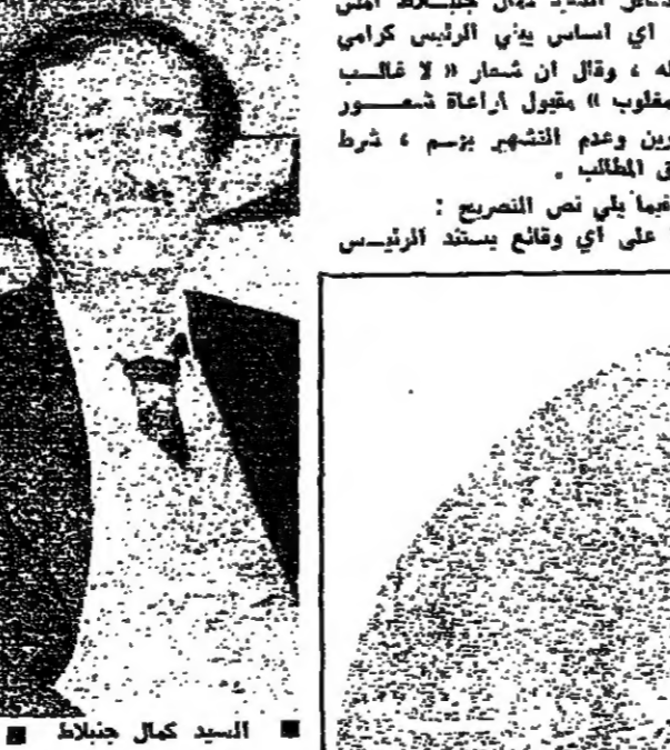
السيد كمال جنبلاط

تساءل السيد كمال جنبلاط امس على اي اساس يفتخر الرئيس كرامي بتفاهمه، وقال ان شعار « لا غالب ولا مغلوب » مقبول اربعة اشهر فقط للمطالب. وقد تابع في نص النصح: « على اي وقلع يستند الرئيس كرامي عندما يتفاهل... » وتحدث الادعاء بقتال عن الوضع قبل، الا اذا كان قوله من قبيل « تعامل جد خيرا » وان كان بحاجة شخصية الى التمسك بالثبات، واصابعه حوله لكي تعود اليه اصداء هذا القتال، لان في بيئات يسار الجليل وشرف قسيس وسواها كم احد ان الضيقة قد تفتت كرامياً عن الماضي، وان الاسطورة التي تروى بالاجداث قد طويت، الا اني ما عاد القول المبتنى لابي شريف قسيس يحكمه على قناعة دستورية القوانين والمجلس الاتصالي - الاتصالي كنهها مؤسسة غير مستوية ومحاكمة محاكمة المسؤولين.